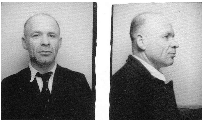
Fig. 2: Foto de frente y perfil de Monsieur Shoshani

Si bien no se sabe con certeza por qué Shoshani vino a radicarse los últimos años de su vida en Uruguay, se manejan varias hipótesis. Éstas últimas se encuentran descritas en el libro Monsieur Chouchani. L'énigme d'un maître du XXe siècle (1994), del periodista franco-judío Salomón Malka 11 . En este libro, Malka realiza una investigación exhaustiva de la vida de Shoshani a través de testimonios muy variados: ex alumnos, rabinos, universitarios, docentes, peluqueros, responsables de instituciones judías, etc. Sobre la elección de Uruguay como país de destino, el autor señala que Shoshani solía contestar: “Me instalé aquí porque en un país pequeño no hay grandes problemas” (Ibidem:117). Unas páginas más adelante, aparece otra frase con una explicación similar: “Un cubo de basura dónde a nadie se le ocurriría arrojar una bomba atómica” (Ibidem:122).