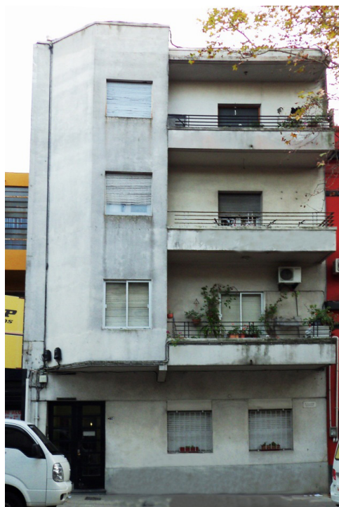
Fig. 5: Calle Maldonado N° 1093, 2do. Piso, Montevideo. Último domicilio en donde Shoshani residió