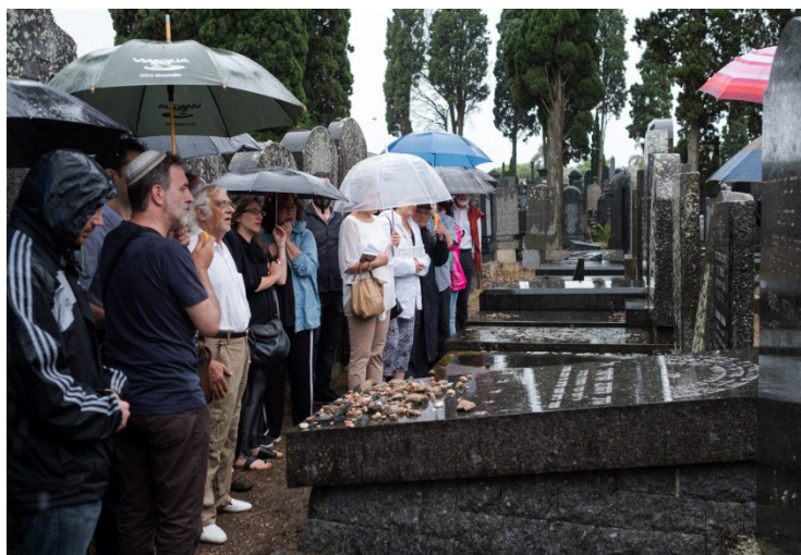
Fig. 5: Haskarah 30 en homenaje al quincuagésimo aniversario del fallecimiento de Monsieur Shoshani

En tal sentido, desde hace cuarenta años las visitas a la tumba de Shoshani vienen in crescendo , especialmente en el aniversario de su fecha de defunción. Actualmente, casi todas las semanas su tumba recibe visitas de personas provenientes de todas partes del mundo. Su tumba se ha transformado en objeto de culto. En las entrevistas que realizamos a los funcionarios de las tareas de mantenimiento en el cementerio israelita de La Paz, estos nos manifestaron que todas las semanas concurren personas en pequeños grupos a visitar la tumba de Shoshani. En menor medida concurren visitantes en forma individual (Fig. 5).