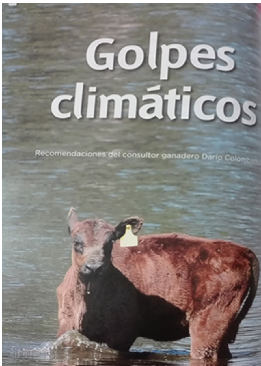
Imagen 10. Golpes climáticos