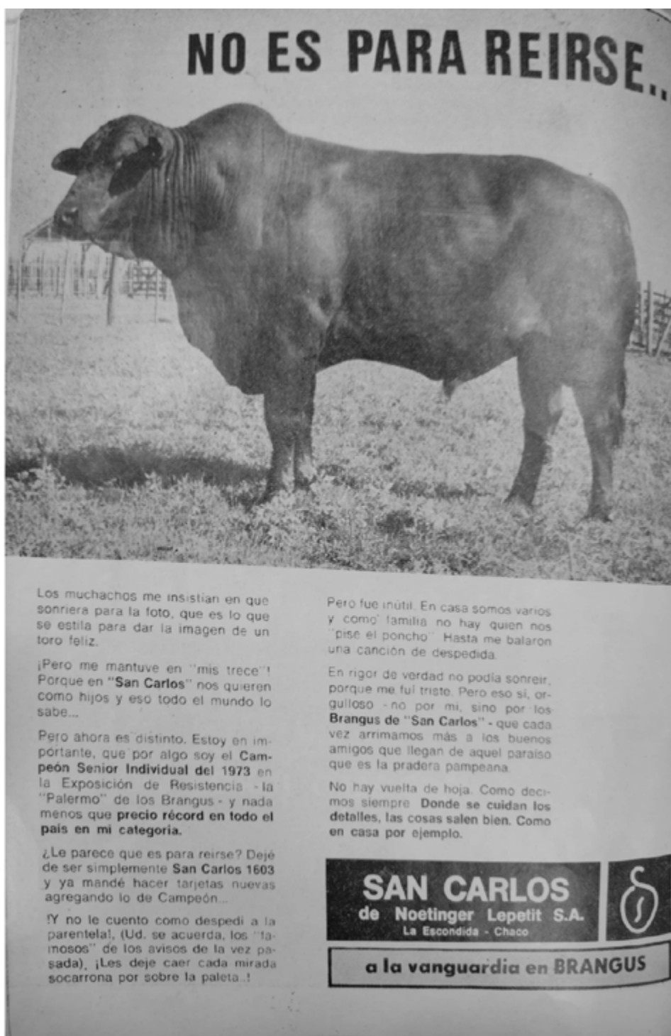
Imagen 6. No es para reírse...