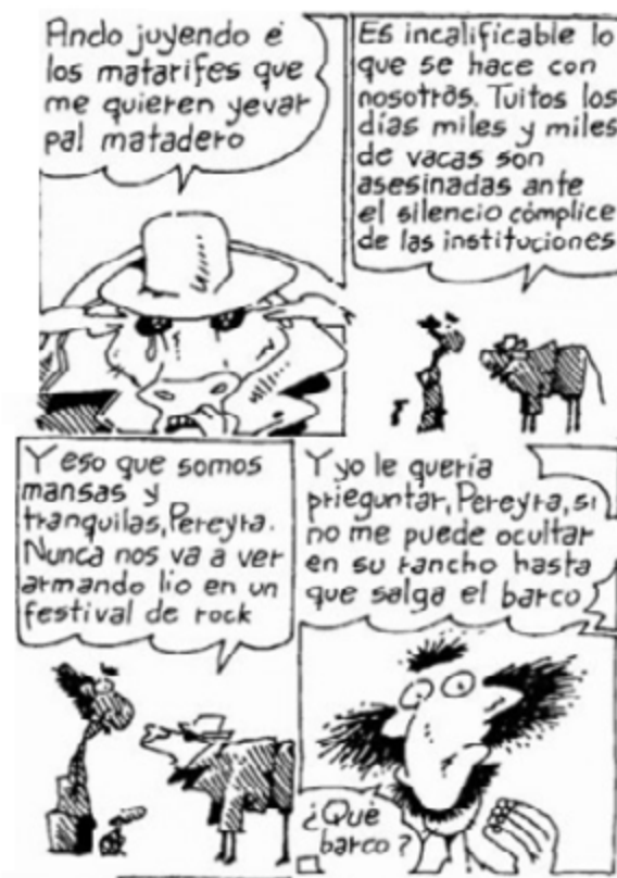
Imagen 2. Fragmento de Inodoro Pereyra «Malaya, triste destino»