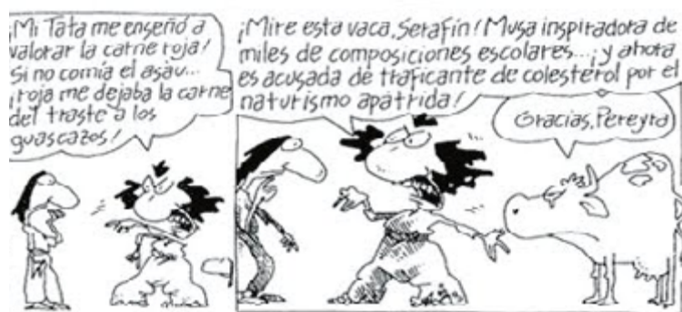
Imagen 4. Fragmento de Inodoro Pereyra «Un feo vicio»