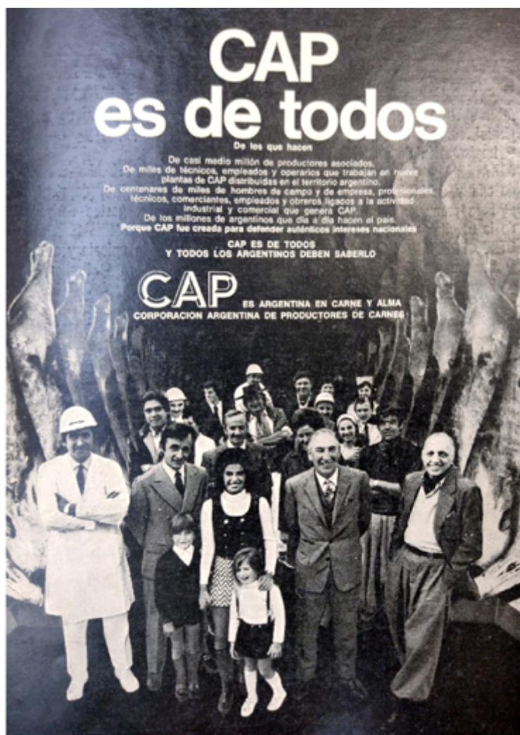
Imagen 13. CAP es de todos