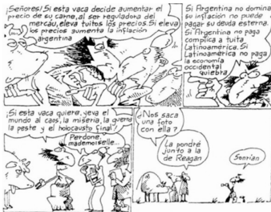
Imagen 1. Fragmento de Inodoro Pereyra «Expresión boba y paso torpe»