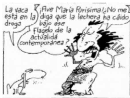
Imagen 3. Fragmento de Inodoro Pereyra «Como perro que va al último»