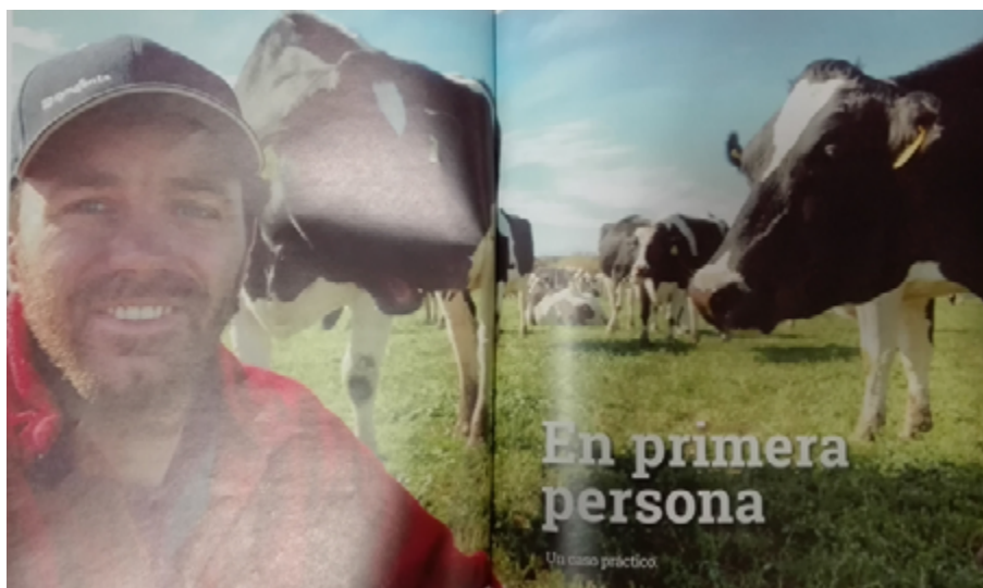
Imagen 8. En primera persona