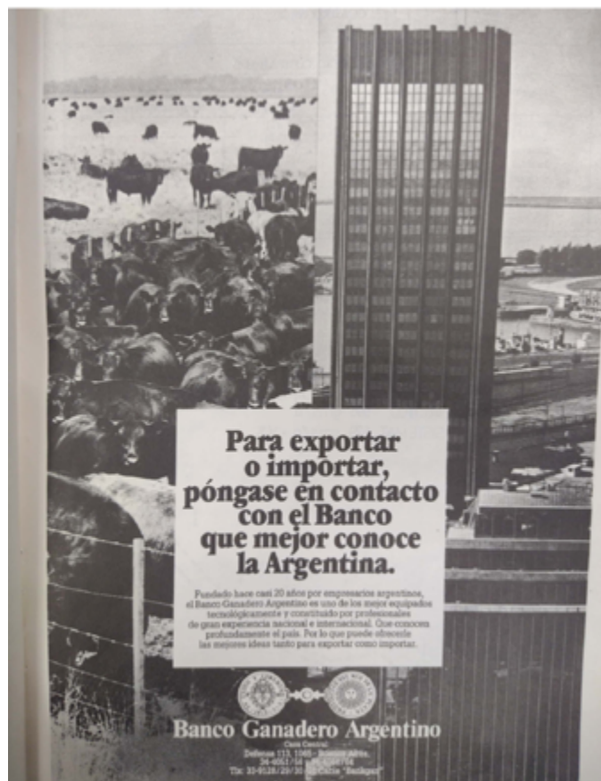
Imagen 12. Publicidad del Banco Ganadero Argentino