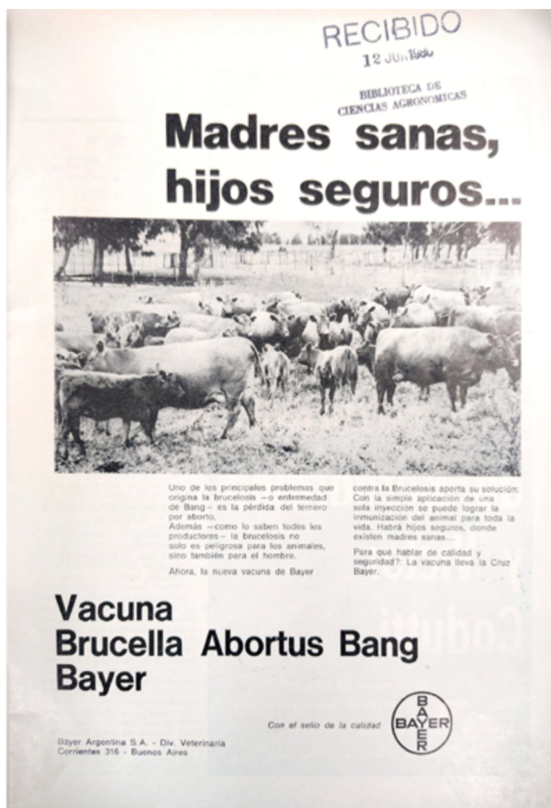
Imagen 9. Madres sanas, hijos seguros...