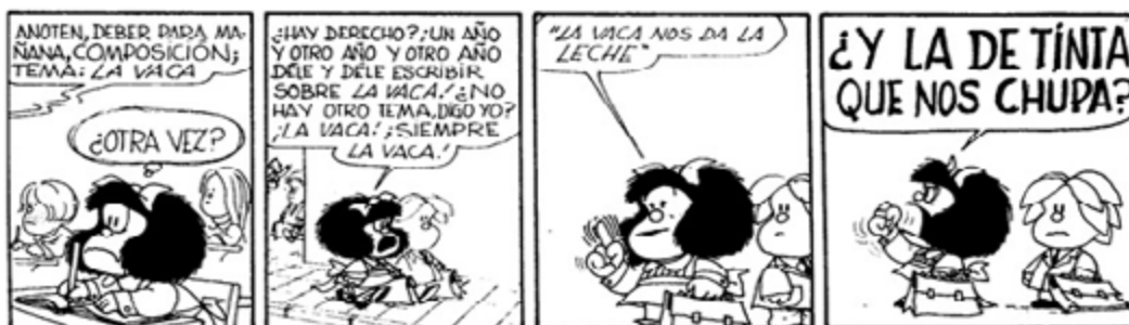
Imagen 5. Mafalda 8